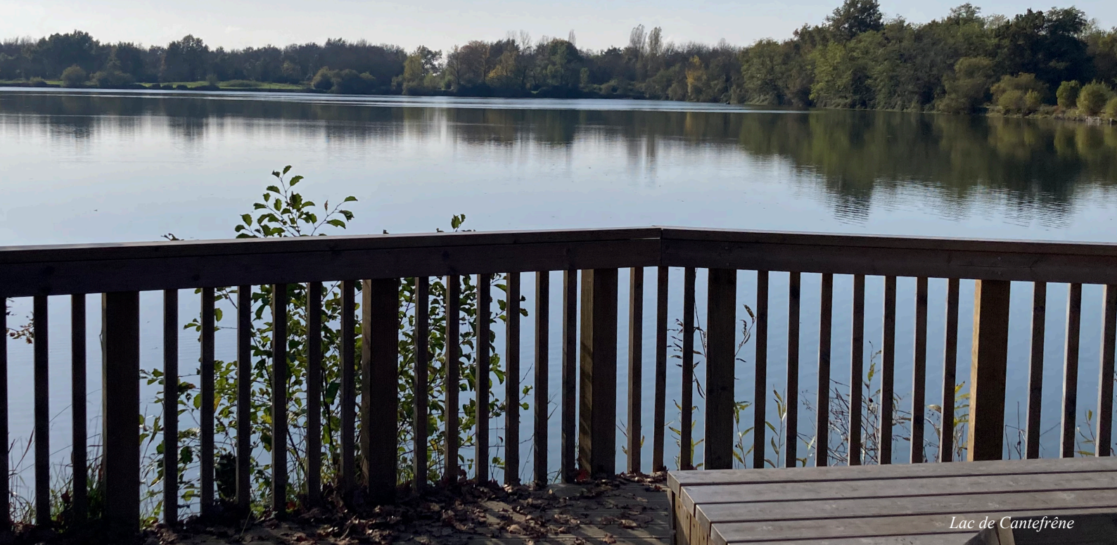
Lac de Cantefrêne